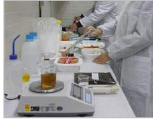
R&D 연구소 제품 개발 및 테스트